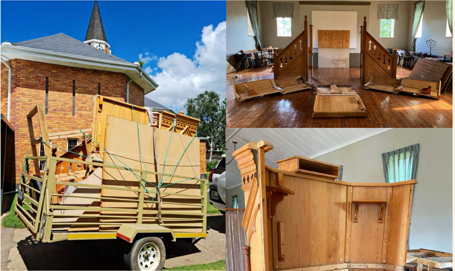
Die preekstoel terug in Hendrina.