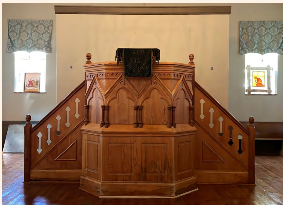
Die preekstoel terug in die eerste kerkgebou.

'n Week of wat later kom die ietwat gehawende groen kanselkleed per koerier in Middelburg aan. Dis meer as 'n eeu gelede by Uniewinkls gekoop en is spesiaal vir die Nagmaal-aan-tafel van Paasfees 2022 weer aangebring.