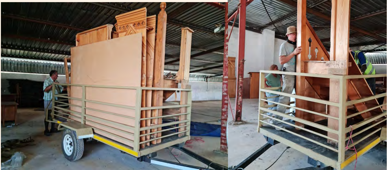
Die preekstoel word opgelaai.