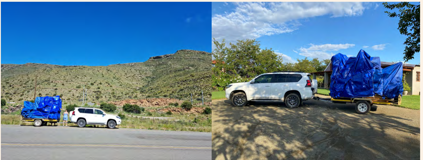
Die preekstoel oppad terug Hendrina toe.

Nadat die reën bedaar het, bedek twee manne die vrag deeglik met die seile. Nou lyk dit asof ons vier blou Porta-Potties vervoer.