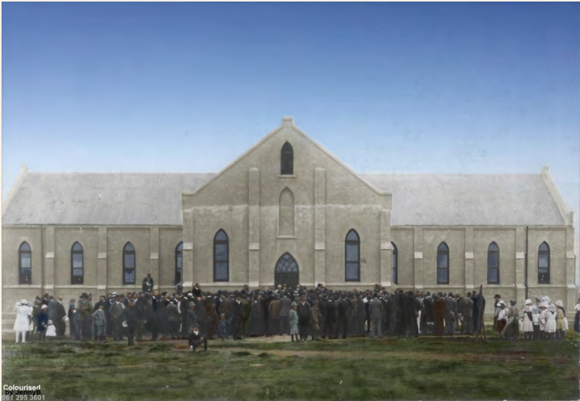
Die inwyding van die Noodkerk Februarie 1918